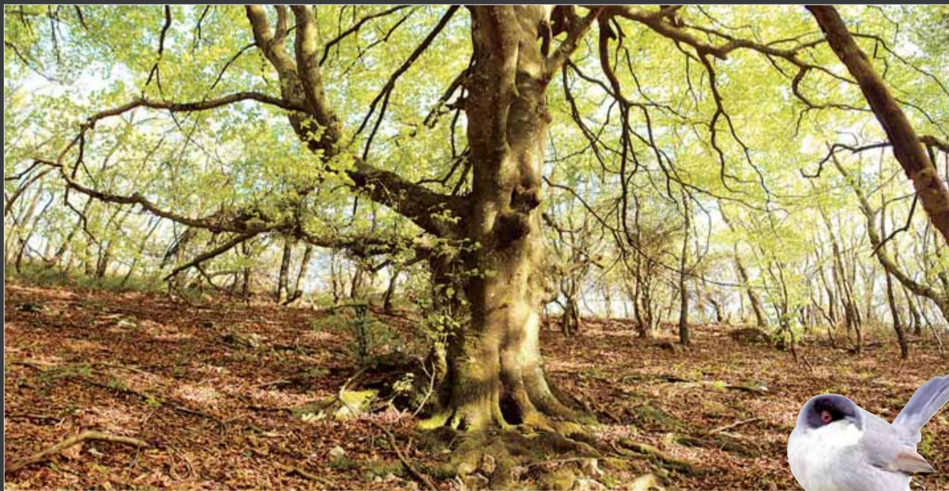
Uno de los muchos bosques de los Montes de Vitoria que rodean la capital alavesa y, sobrepresionado, un ejemplar de la fauna.

taria pública, de los que actualmente Osakidetza carece, para mejorar la autonomía de los mayores como alternativa a unas residencias fuertemente saturadas. PÁGINAS 6-7