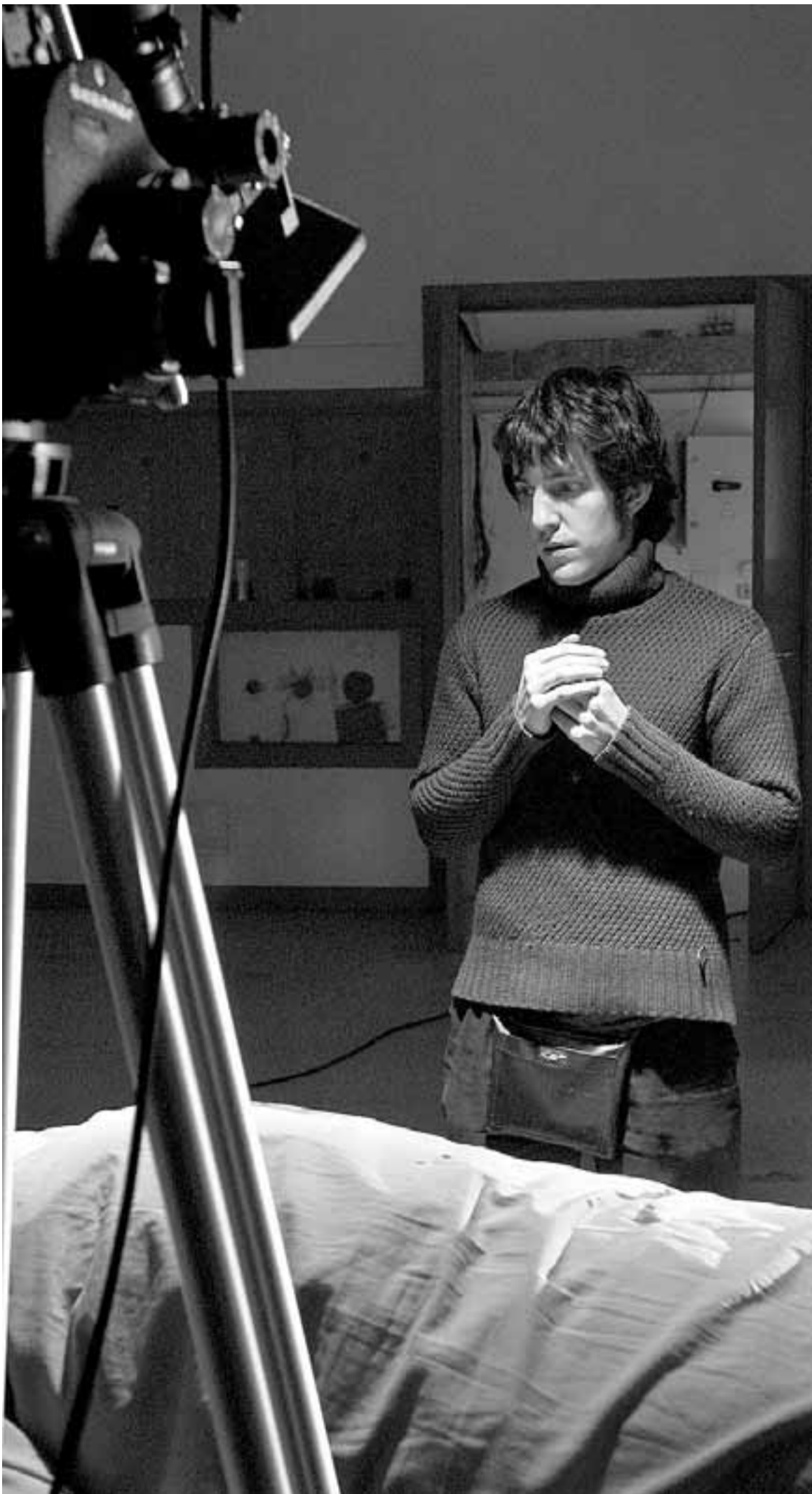
El realizador gasteiztarra, en pleno rodaje de un videoclip.